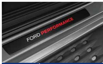
Ốp bậc cửa