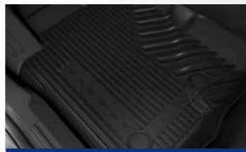
Thảm lót sàn