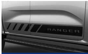
Decal dán sườn xe