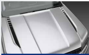
Decal dán mũi xe