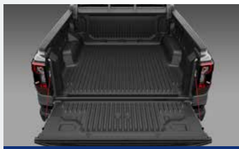
Lót thùng xe