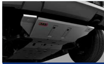
Lều gắn nóc ARB