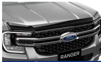
Ốp nắp Capô